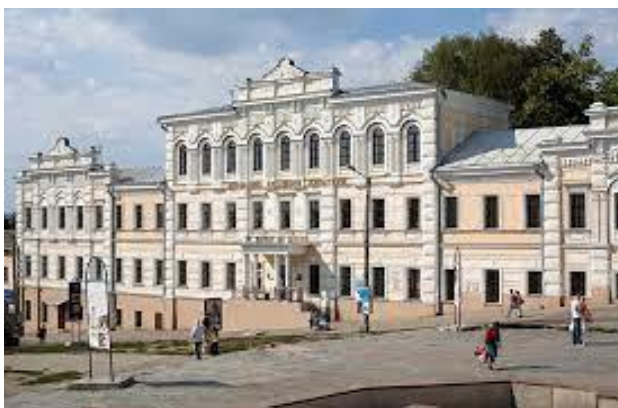
Харківська державна академія культури