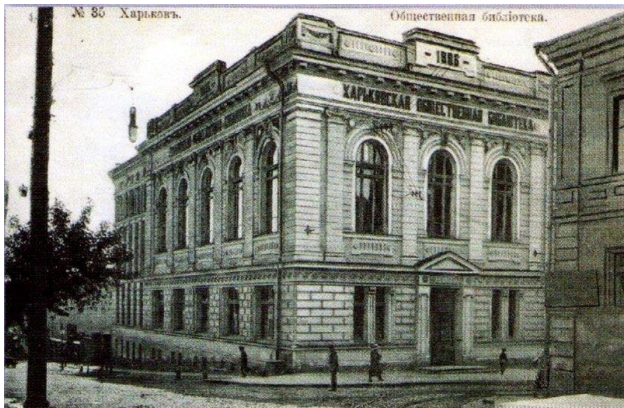
Харківська громадська бібліотека