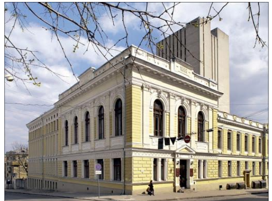
Харківська державна наукова бібліотека ім. В. Г. Короленка