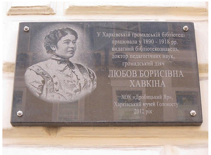
Меморіальна дошка в Харкові