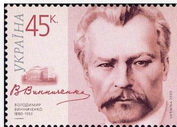
Поштова марка В. Винниченко