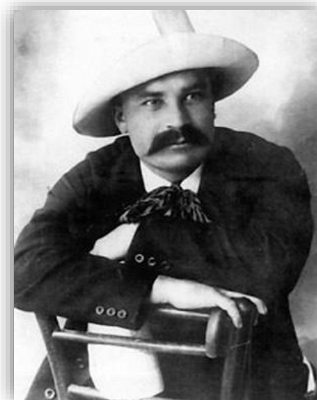
Володимир Винниченко в 1910-ті роки