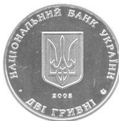
Ювілейна монета «Володимир Винниченко»