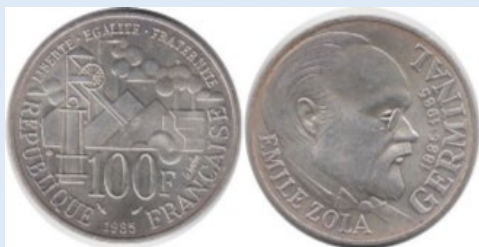
Ювілейна срібна монета 100 франків з зображенням Еміля Золя (Франція)

Інформаційний буклет присвячено 180-річчю від дня народження видатного французького письменника другої половини XIX ст. Еміля Золя, визнаного теоретика і провідного майстра натуралізму (адже не випадково цей художній напрям нерідко називали й золяїзмом).