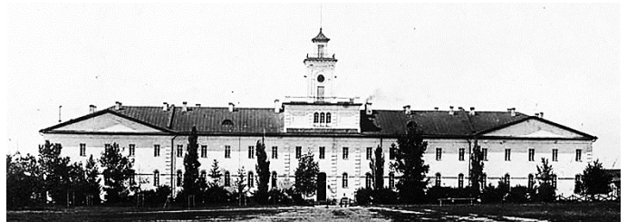
Чугуївське піхотне юнкерське училище

Майбутній військовий діяч, а тоді Петрик Болбочан початкову освіту здобував у сільській церковно-приходській школі, пізніше вчився в гімназії. За традицією, хлопця чекала кар'єра священника. Підліток навіть вступив до Кишинівської духовної семінарії (Seminarul Teologic din Chişinău), де прослухав два повні класи. Отже, духовну освіту Петро Болбочан не здобув, семінарію залишив, а 6 серпня 1905 р.