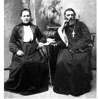
Федір Олексійович і Єлизавета

Болбочан Петро Фёдорович — український військовий діяч, полковник армії УНР, очільник Кримської операції. Народився 5 (17) жовтня 1883 року в селі Геджев (Гиждево) Хотинського повіту Бессарабської губернії (нині село Ярівка Хотинського району Чернівецької області) (про що є запис в Метричній книзі, Кишинівської духовної консисторії Святодимитрієвської церкви, села Годжиєва , за 1883 р. під № 34), в родині молдавського православного священника та помічника благочинного 4-го округу того ж повіту Федора