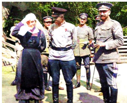
Генерал-хорунжий Армії УНР Олександр Натієв та Петро Болбочан (праворуч), весна 1918 р.

10 квітня 1918 року штаб запорожців одержав таємний усний наказ уряду про виділення з корпусу окремої групи, забезпеченої всіма видами зброї на правах дивізії під командуванням полковника Болбочана. Перед ним поставлене окреме стратегічне завдання: випереджаючи німецькі війська на лінії Харків-Лозова-Олександрівськ-Перекоп-Севастополь, звільнити Кримський півострів від більшовиків, захопити Севастополь. Кінцевою точкою військової операції мав стати Чорноморський флот, який планували включити до складу українських збройних сил.