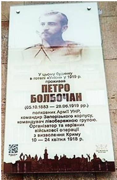
Меморіальна дошка у Івано-Франківську