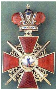
Орден Святої Анни 3-го ст. з мечами та бантом за бойові дії в період з 20 жовтня по 1 грудня 1914 р. (Наказ 5 Армії від 27 січня 1915 р. № 185).