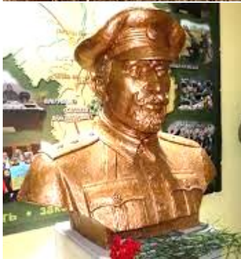
Погруддя було відкрито у Харкові на території військової частини 3017 Східного оперативно-територіального об'єднання НГУ.