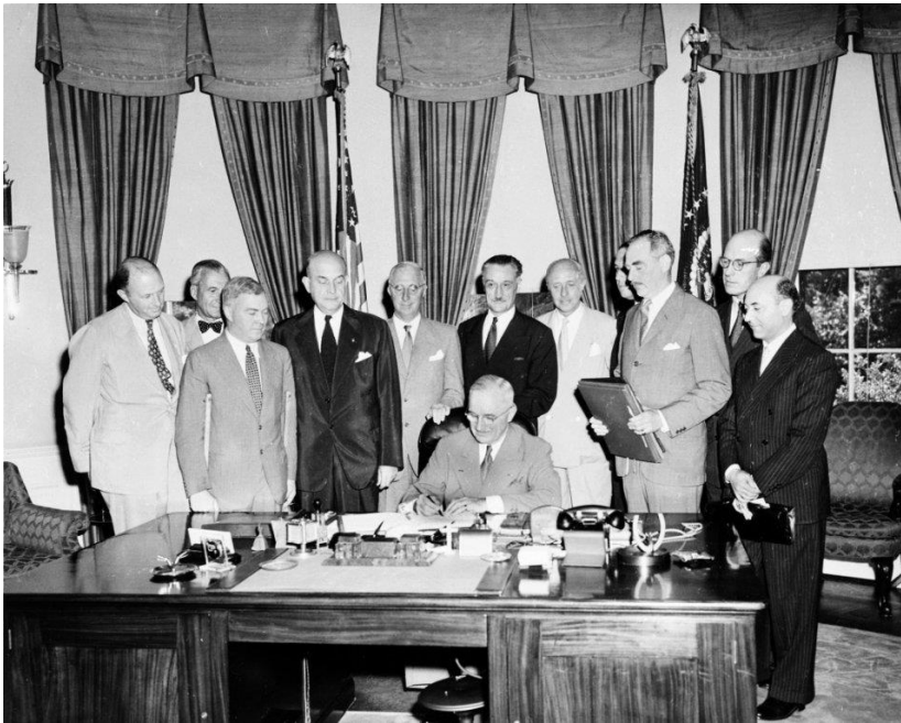
Підписання Північноатлантичного договору

Повоєнний період у Європі був непротим. В лютому 1948 року Комуністична партія Чехословаччини за прихованої підтримки СРСР повалила демократично обраний уряд країни. Тоді ж у відповідь на демократичну консолідацію Західної Німеччини Радянський Союз заблокував Західний Берлін, контрольований союзниками.