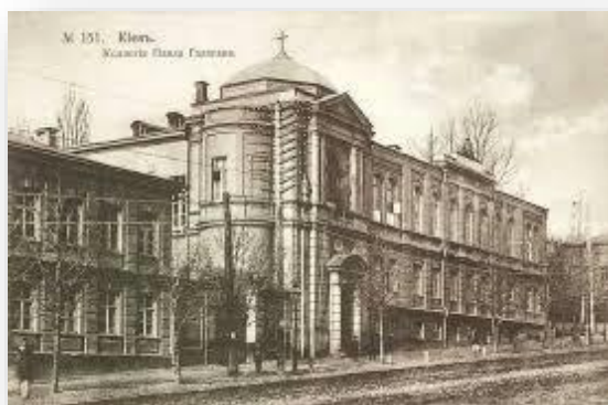
Будівля Колегії Павла Галагана

По закінченні Колегії 1911 року Драй-Хмара вступив на історико-філологічний факультет Київського університету. Тут він працював у семінарі академіка Володимира Перетца. 1915 року Михайло, закінчивши університет, залишився в ньому для підготовки до професорського звання, яке отримав у 1918 р.