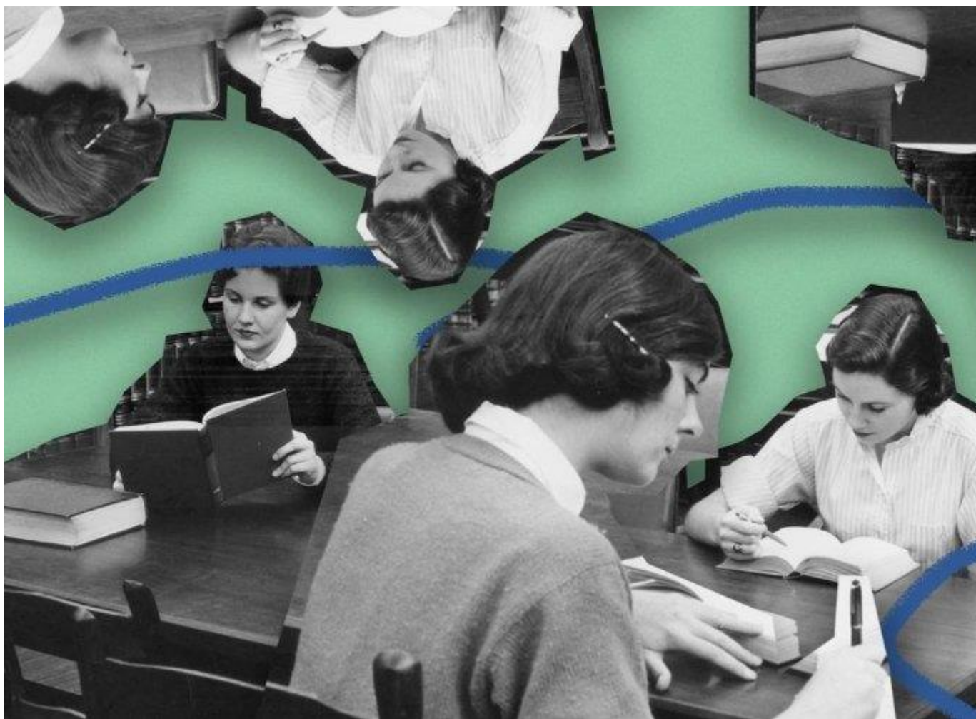
Колаж: Микита Шклярук

- “Добрий день! Як пройти до бібліотеки?”