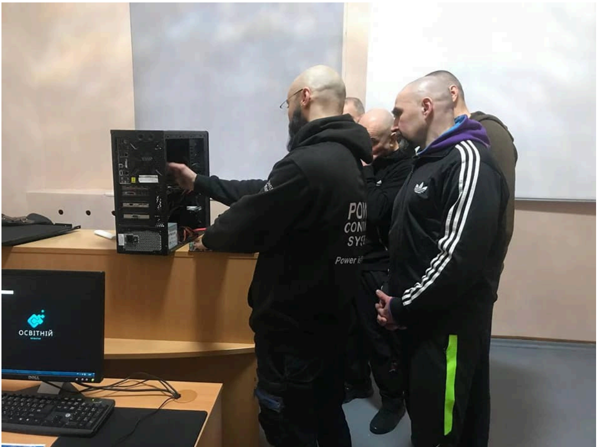
Заняття з комп'ютерної грамотності довічно ув'язнених Житомирські УВП № 8.