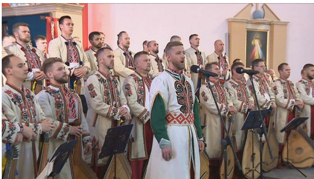
Narodowa Kapela Bandurzystów Ukrainy zagrała w Zielonej Górze

Dary trafiły do zielonogórskiego Norwida w ramach organizowanej przez Bibliotekę im. Lesi Ukrainki w Kijowie akcji „Książka w ślad”. Przekazali je mieszkańcy Kijowa, wydawnictwa i organizująca akcję kijowska księżnica.