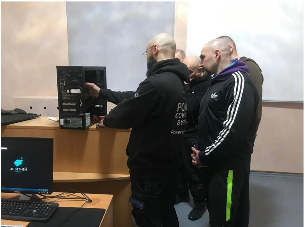
Заняття з комп'ютерної грамотності довічно ув'язнених Житомирські УВП № 8.