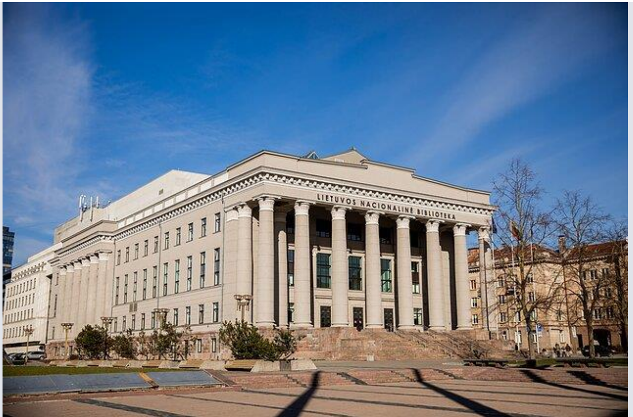
Nacionalinė Martyno Mažvydo biblioteka