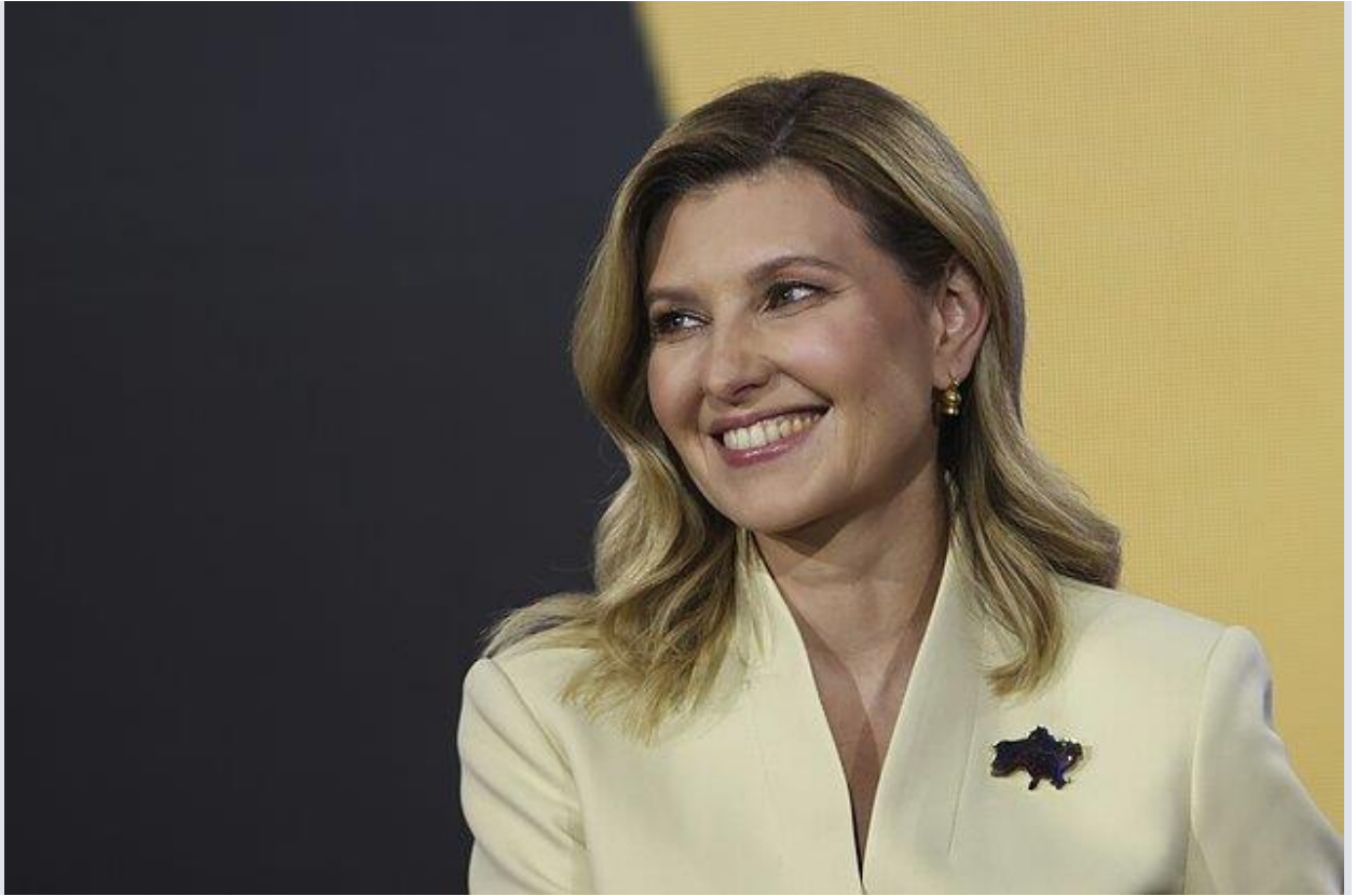
Olena Zelenska

2023 m. sausio 11 d. Vilniaus centrinėje bibliotekoje vykusio renginio metu pagal projektą „Knygos iš paskos“ Vilniaus ukrainiečių mokyklų pirmokams buvo padovanota 150 knygų ukrainiečių kalba.