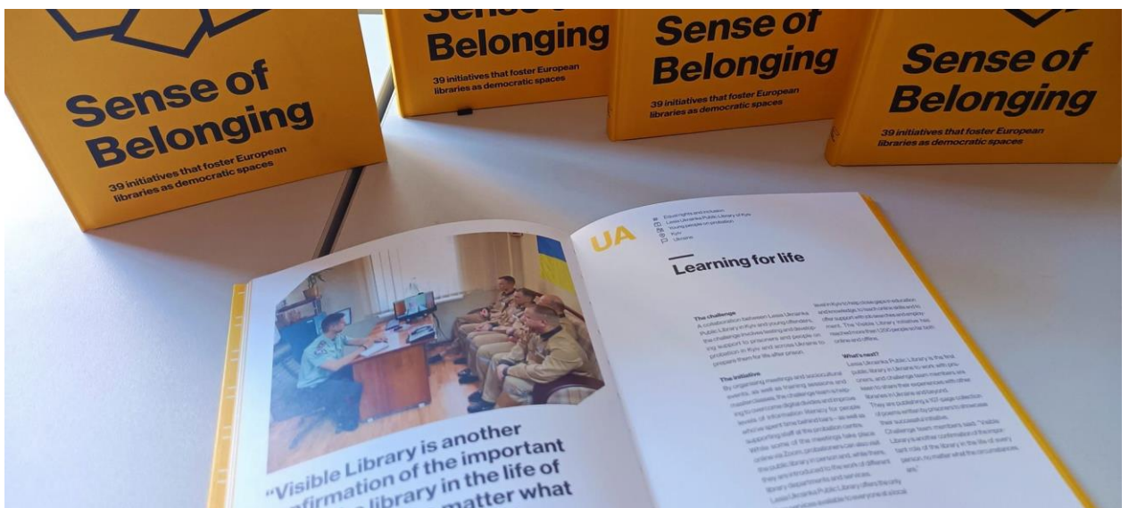
Досвід київської бібліотеки увійшов до буклету.

До слова, досвід усіх учасників програми «Європейський виклик» можна почитати у буклеті «Sense of belonging» , що розкриває життєво важливу роль бібліотек у суспільстві.