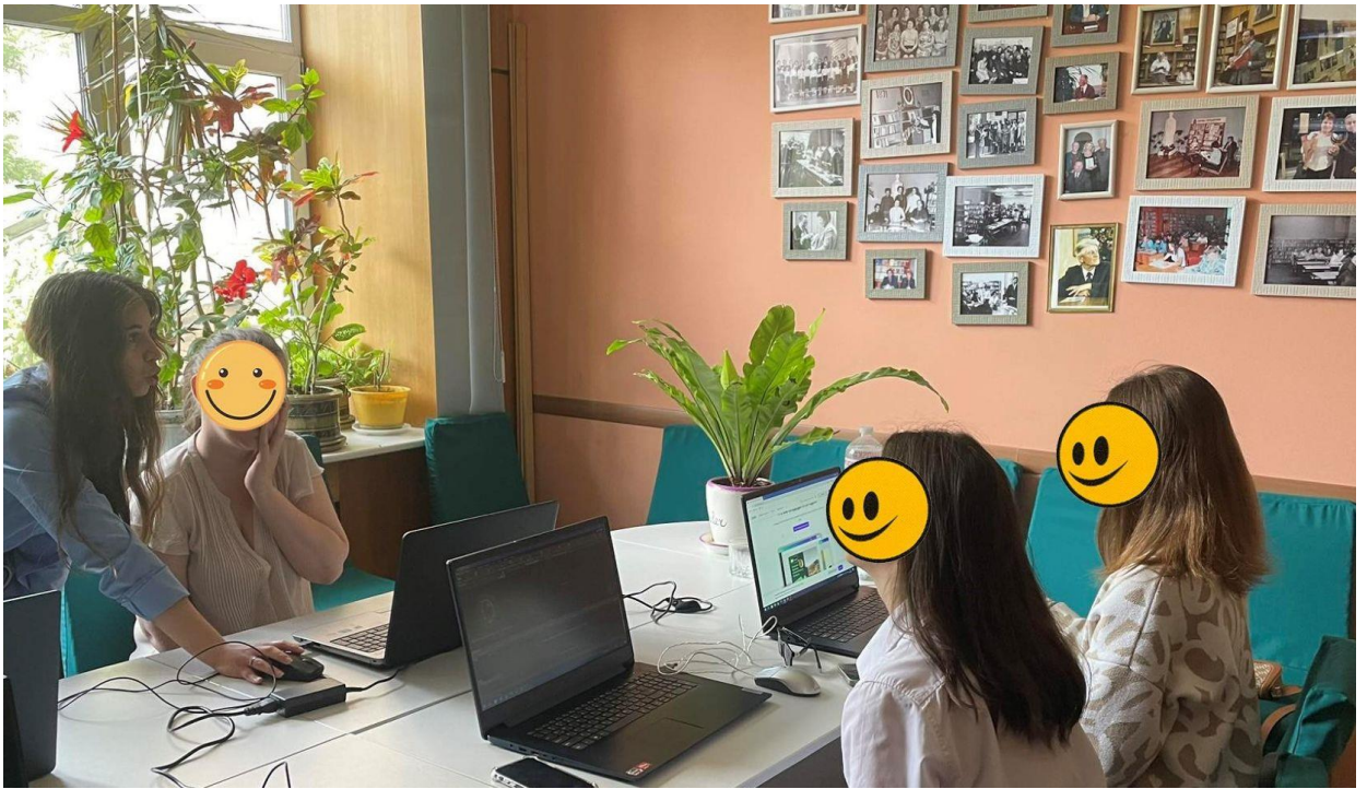
У бібліотеці запрацювала артлабораторія для осіб, які на пробації.

Розпочала роботу студія літературного розвитку для засуджених. Особи, які на пробації, мали можливість відвідувати бібліотечні заходи, покази вистав у відділі мистецтв бібліотеки. За підтримки Департаменту з питань виконання покарань побачила світ збірка поетичних творів засуджених під назвою «Народжені бути вільними».