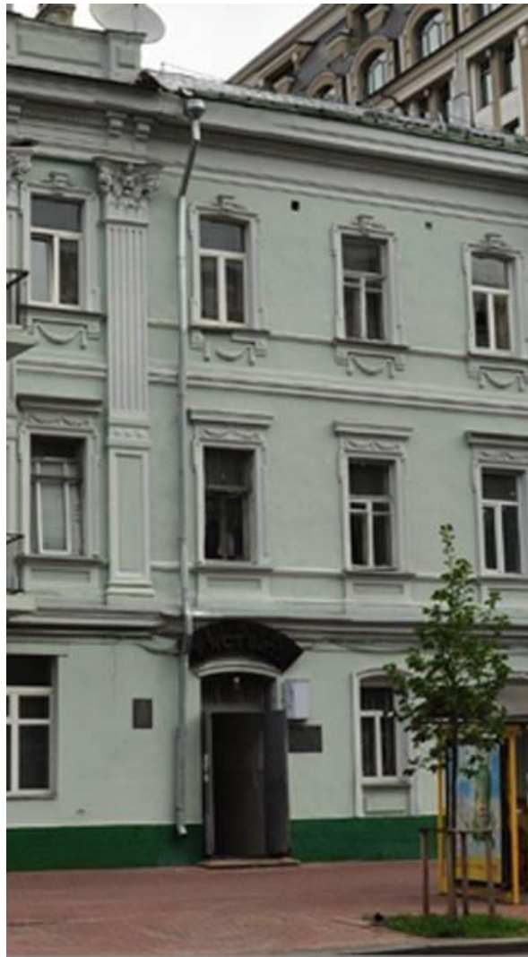
Вхід до відділу мистецтв. (вул. Велика Житомирська, 4)