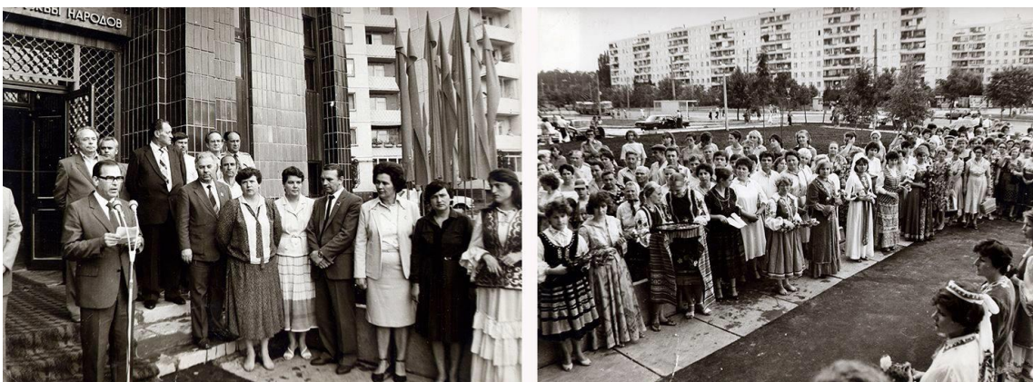
Відкриття Бібліотеки Дружби народів

З урахуванням активної методичної та організаторської діяльності, що провадила ЦБ ім. Лесі Українки як всесоюзна і республіканська база з питань централізації масових книгозбірень та координації роботи бібліотек усіх систем і відомств району, високого професійного рівня її працівників, наказом Головного управління культури виконавчого комітету Київської міської ради народних депутатів від 14 грудня 1979 р. № 251 з 1 січня 1980 р. ЦБ ім. Лесі Українки Шевченківського району реорганізовано в Центральну міську бібліотеку імені Лесі Українки для дорослих (ЦМБ ім. Лесі Українки), одночасно вона залишилась центральною бібліотекою ЦБС Шевченківського району.