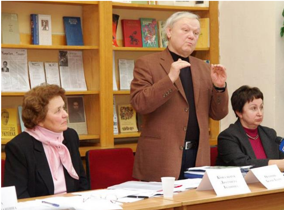
Герой України, письменник Б. Олійник на прес-конференції щодо захисту приміщення бібліотеки від рейдерських посягань

До вирішення проблеми з приміщенням бібліотеки міська влада повернулась на початку 2000-х рр., передбачивши його будівництво за програмою «Розвиток бібліотечної справи в м. Києві на 2003–2006 роки», затвердженою рішенням сесії Київради від 27 лютого 2003 р. № 314/474; фінансування у сумі 150 млн грн було заплановано рішенням сесії Київської міської Ради від 2 лютого 2006 р. № 6/3097 «Про внесення змін до рішення Київради від 27.12.2005 року № 662/3083 "Про програму соціально-економічного та культурного розвитку м. Києва на 2006 рік"». Новим рішенням сесії Київської міської Ради від 6 грудня 2007 р. № 1380/4213 «Про затвердження міської програми «Розвиток бібліотечної справи в м. Києві на 2007–2010 роки» також передбачалося до 2010 р. побудувати нове спеціалізоване приміщення для ПБ ім. Лесі Українки. Проте це рішення не було реалізоване.