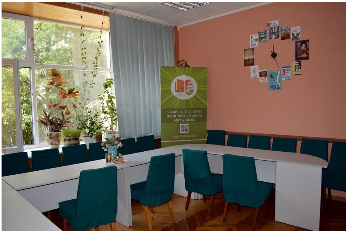
Зала громадських ініціатив

До послуг користувачів бібліотеки – оцифрована колекція аудіозаписів класичної музики (симфонічні, оперні, балетні та камерно-інструментальні записи), регулярні виставки живопису та малярства з приватних колекцій, медіатека, домашній кінотеатр.