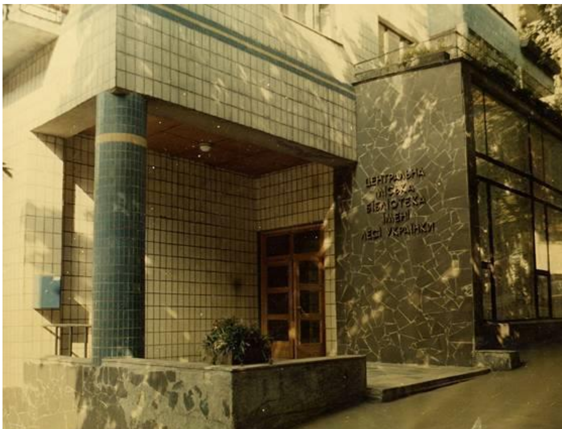
Вхід до приміщення бібліотеки на вул. Тургенєвській, 83-85

У 1960-х роках замале, непристосоване приміщення стримувало розвиток бібліотеки, у фондах якої вже зберігалось понад 60 тис. видань. Попри непрості умови, Бібліотека ім. Лесі Українки поступово набувала авторитету однієї з кращих в організації бібліотечного обслуговування киян. Налагоджувалася співпраця з різними установами та організаціями. Кількість читачів бібліотеки зросла до 6 тис., щоденно її відвідували понад 200 осіб.