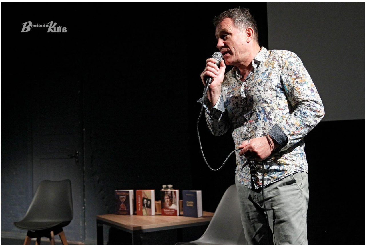
Народний артист України Анатолій Гнатюк заспівав присутнім українських пісень.