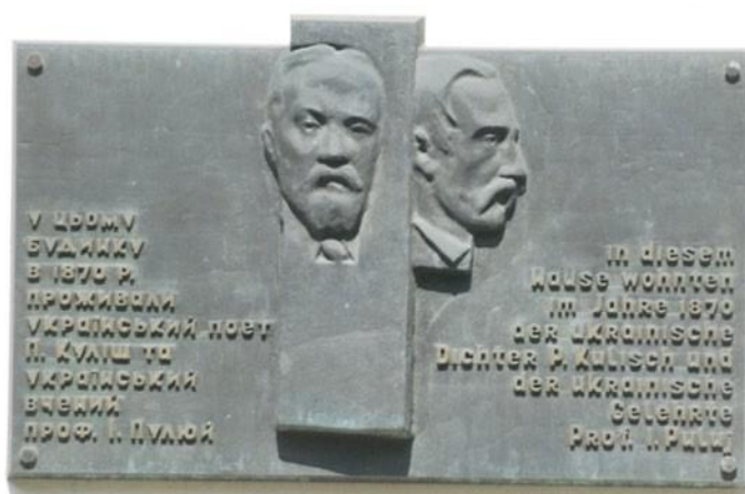
Меморіальна дошка на будинку у Відні, де мешкав П. Куліш (встановлена 30 квітня 1998 р.)