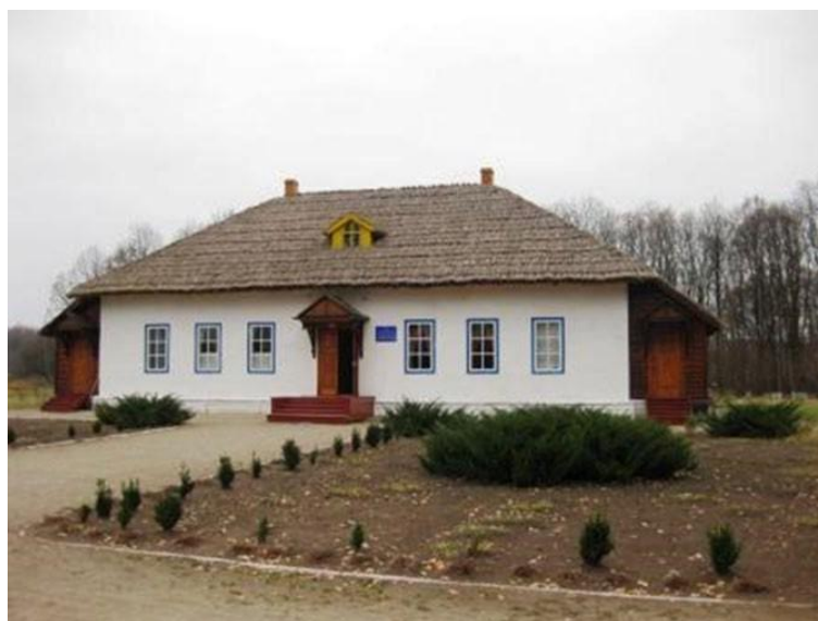
Будинок Кулішів після реставрації (сучасна фотографія)