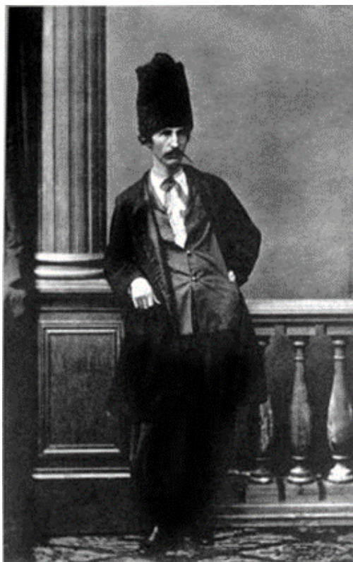
Панько Куліш (1859 р.)