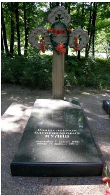
Могила П. О. Куліша