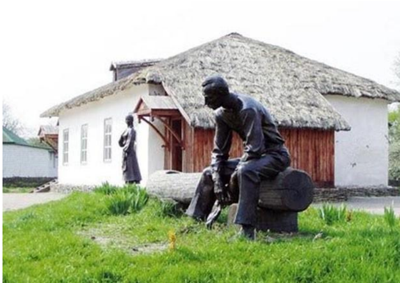
Історико-меморіальний музей-заповідник «Ганнина пустинь»