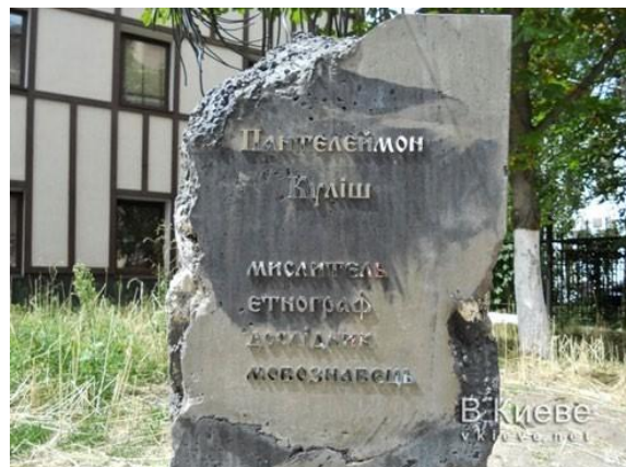
Пам'ятник П. Кулішу м. Київ