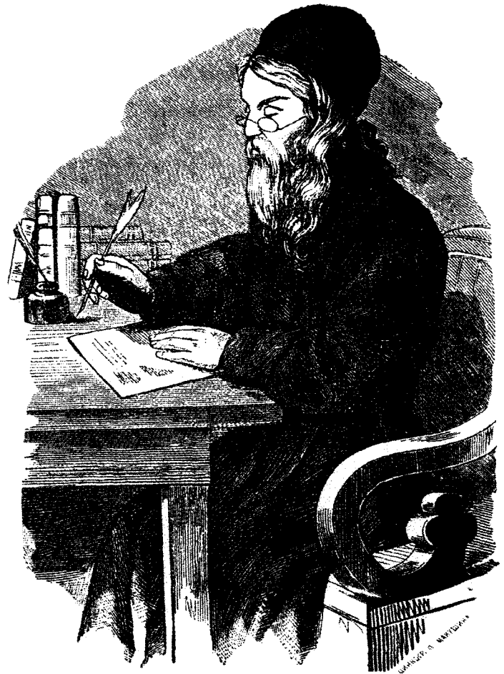
Архимандрит Макарий (Глухарев), основатель Алтайской Духовной Миссии