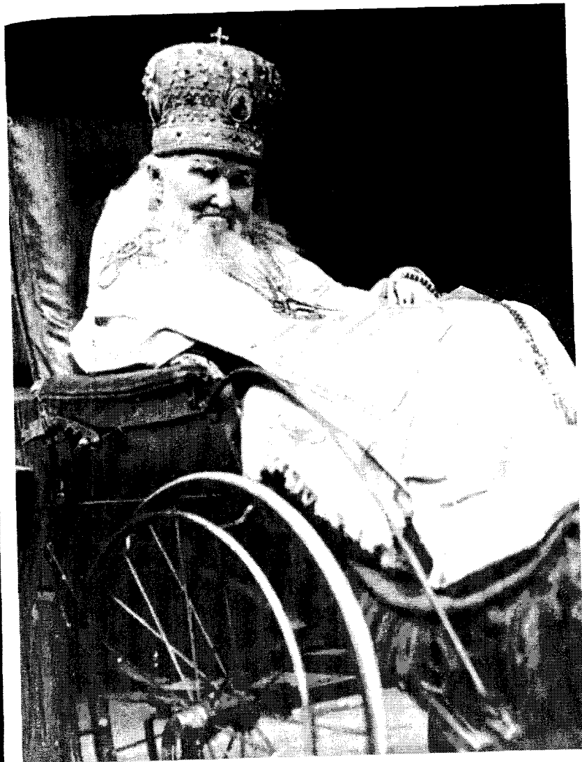
Митрополит Московский Макарий (Невский) в последние годы жизни.

Письмо митрополита Московского Макария (Невского) к игуменье Анастасии. Из собрания Православной Гимназии во имя Преподобного Сергия Радонежского. Публикуется впервые.